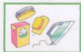
ДЕЙСТВИЯ С ОДЕЖДОЙ